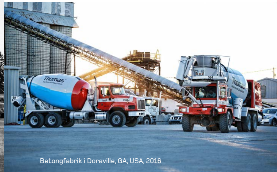
Betongfabrik i Doraville, GA, USA, 2016