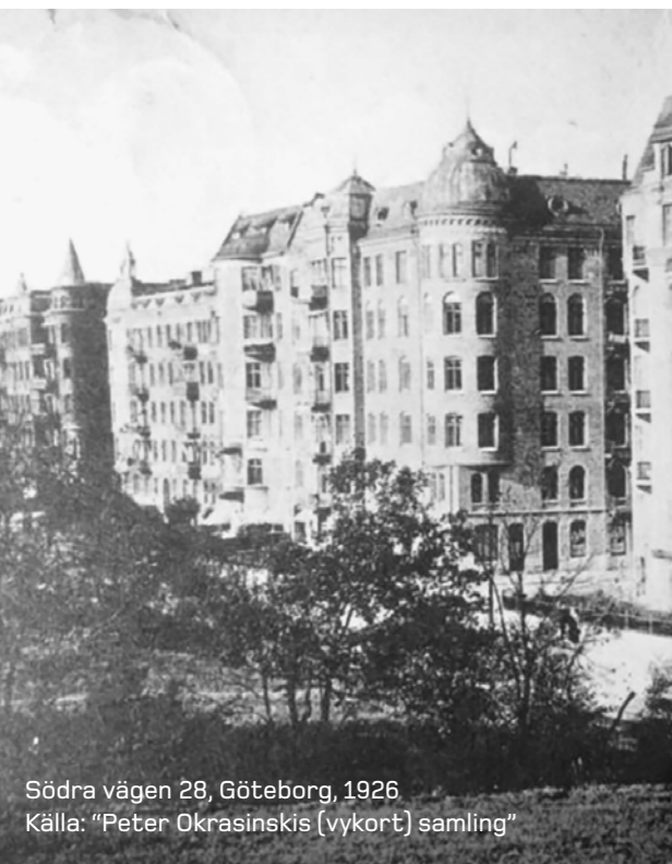
Södra vägen 28, Göteborg, 1926

Piotr Radliński, fabrikschef, Szczecin, Polen