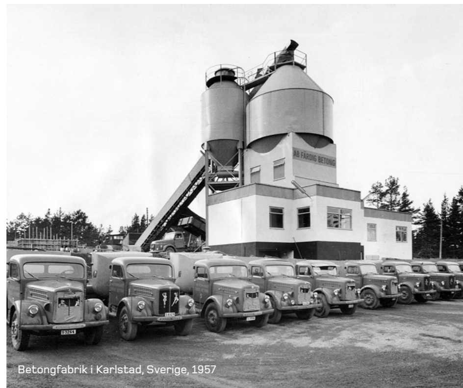
Betongfabrik i Karlstad, Sverige, 1957