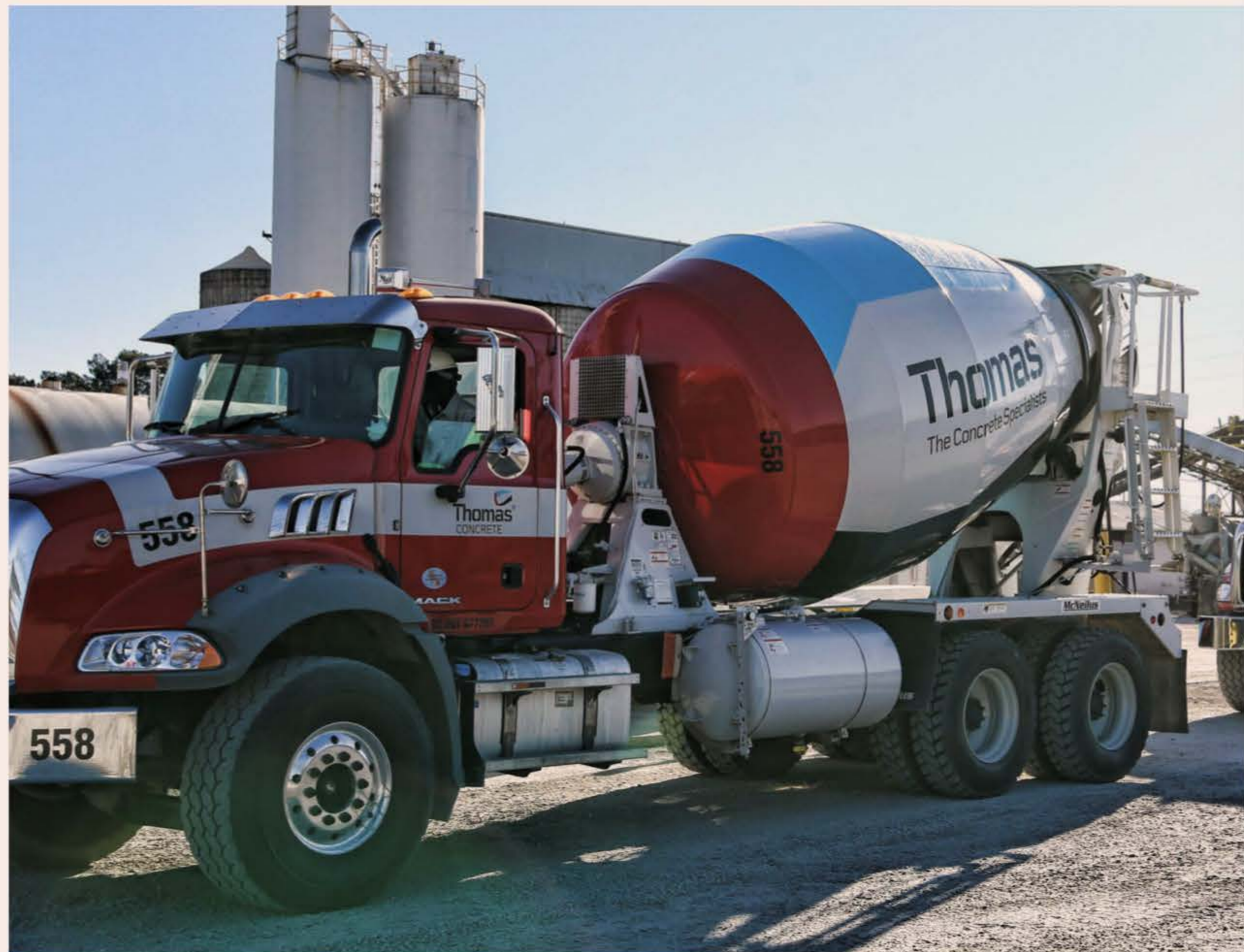
ORDERBOKEN PÅ REKORDNIVÅER. Knappt hälften av det svenska betongbolaget Thomas Concretes intäkter kommer från bostadsprojekt tack vare stor inflyttning de senaste åren.